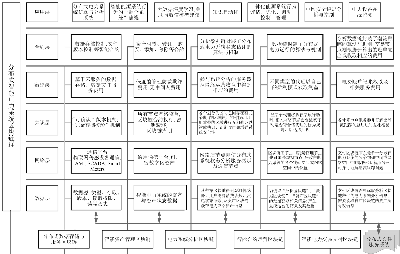
图 1 分布式智能电力能源系统区块链群: 架构与分层功能

基于上述分布式智能电力系统和区块链的特点, 本文提出了如图 1 所演示的一种基于区块链群的实现方式, 以及依存于其上的分布式智能电力能源系统数据服务、资产服务、系统分析、资源规划与优化、自主运营和智能支付等机制. 区块链群中的每个区块链都执行相应的逻辑或物理功能, 而且互相依赖和交互. 在下一节, 对此区块链群进行了具体描述.